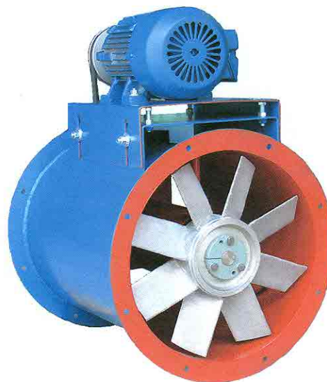
Ventilador Modelo AXB tamaño 182-834, con rotor (opcional) de fundición de aluminio.

El cuerpo del ventilador está rígidamente soldado a cordón continuo para asegurar su hermetismo. Las bridas son de gruesa solera con barrenos estándar para su fácil instalación. La base del motor es ajustable para tensar las bandas y corre sobre una base fija, que refuerza y transfiere el peso uniformemente al cuerpo del ventilador.